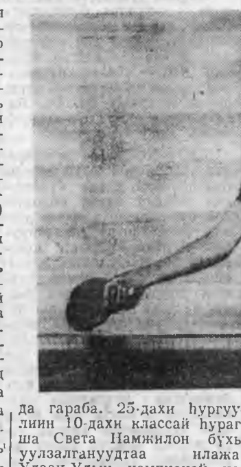
Гурбадахи хууриин түлөө