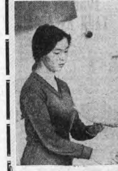
Гурбадахи хууриин түлөө

шанга тэмсэл болоо. О. Иванов С. Ждановые 2:0 тоотойгоор шүүжэ, гурбадахи шанга хүртээн байна.