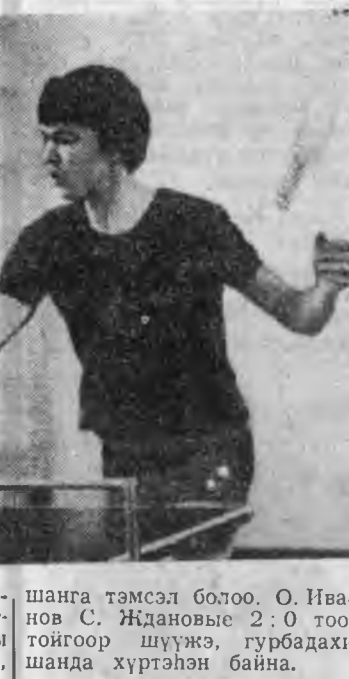
Гурбадахи хууриин түлөө

Эдиршүүдэй дунда столон теннисээр Улаан-Удэ хотын турдуу хуури эзэлхын түлөө мурьсөөн нарин сэмбын комбинатай спортзал соо боложо дүүрбэ.