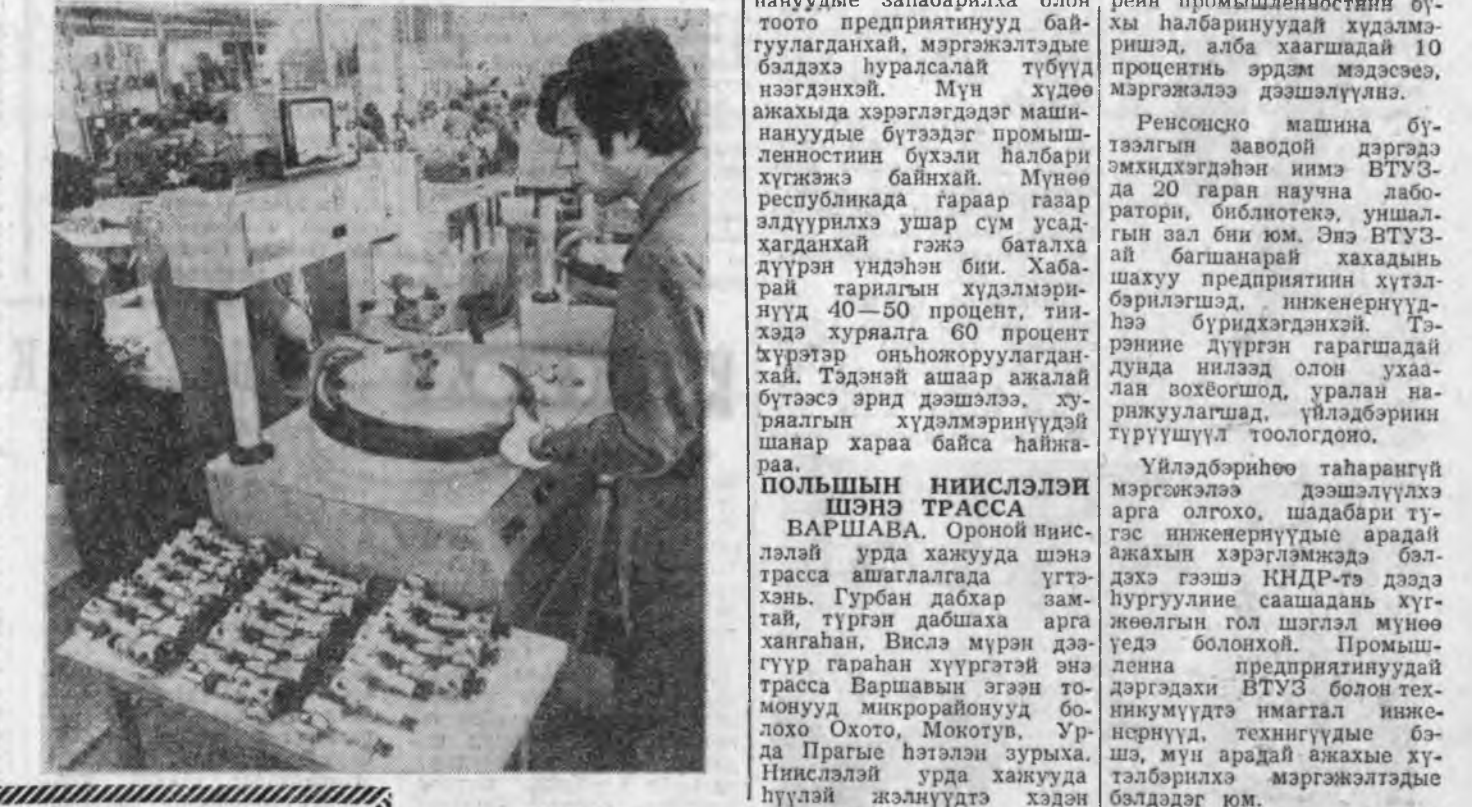
Улан Бэлиг Балбаран Хүгжэнэ

«Уласхоорондын харилсаануудта эзэрхэн зонхилолгын политика бөөлүүлэхэ болохогүй байхан тухай» асуудалы энэ сессин дээрэ зүбшэн хэлсэжэ гэгэн совет дурадхал хураахайн ашаар талдэ СНА-гай хашалта баалтаар хэлдэнэ. Дүтын Зүүн зүгтэй нууса үгсэснлэ хабаралташлай улам эхэсэр гансаардаа байһыне юэнхэн хөөрлөөн гэршэлно. ИДРП-гай гадаадын хэрэгүүдэй министр Салем Салех Мухаммед үгэ хэлэхэдэ, Кемп-Дэвидтэй хэлсээн хадаа Дүтын Зүүн зүгэй арадуудта өөһдөнгөөр нанал болдыне баадха гэгэн СНА-гай нэгдэлтэ болоно гэжэ эгэнэ.