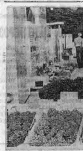
Хизаарай ажахынуудта овоц, алим жэмэс, виногра болон сайн набаһа-нууды үйлдэбэригэ тухай хөөрөнэй выставка нэгдэбэ. Сад болон виногра тариаты эрхилхэгийн талаар Хойто-Ка-казай зонаһаа үлдэм-шэнжэлтын ин-

Дунда Азинн ба Казах-станай шэнэ шэнэ районууд клопоого машинаар хура-жа эхилэнхэй. Ажахынуудай ажалшад комбайнуудай ту-халамжаар ургасынһаа 85 процентые хадажа абахые оролоно.