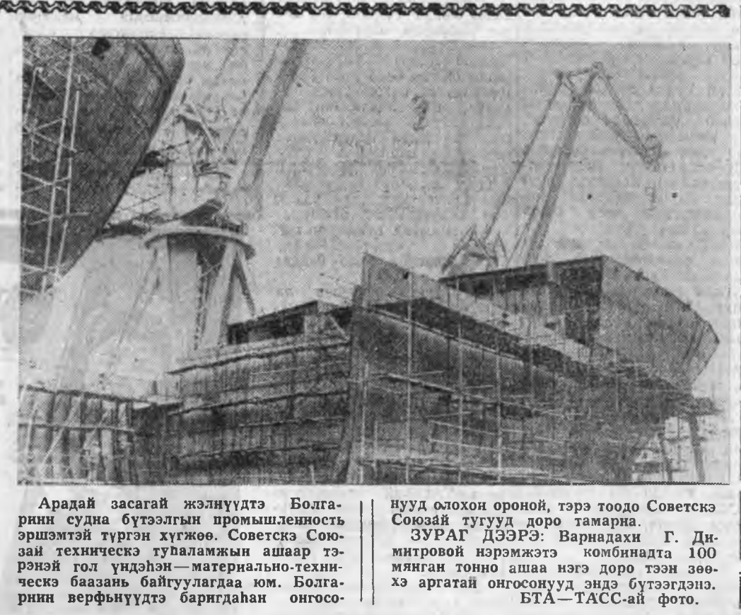
Арадай засагай жэлүүдтэ Бол гарин судна бүтээлгын промышленосты эрэмжтэй түргэн хүжөө. Советскэ Сою зай техникческэ тулалжарына ашаар тэрэнэй гол үндээн—материально-тех никческэ базаны байгуулагдана юм. Бол гарин верфиүүдтэ баригданан онгосо нууд олохон ороной, тэрэ тоодо Советскэ Союзай тугууд дору тамарна.