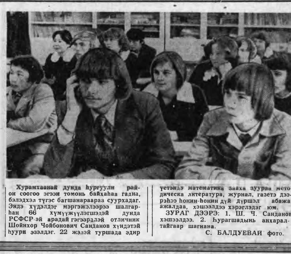
Хурмаханай дунда гургуули район соогоо гэсэн томонь байханаа гална, бэлдэхэ тугса багшанаараа суурхадат.