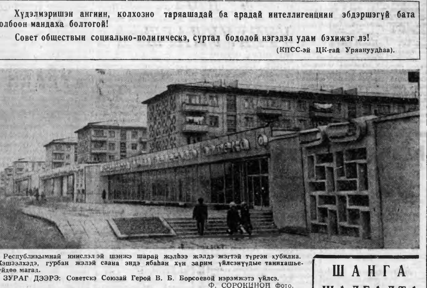
Республикынай нинслэлэй шэнжэ шарай жэлхээ жэлдэ жэгтэй түргэн хубилна. Жэшээлхэд, гурбан жэлэй саана эндэ ябахан хүн зарим үйлсэнуудые танихашыгүйдөө магал. ЗУРАГ ДЭЭРЭ: Советскэ Союзай Герой В. Б. Борсовей нэрэмжитэ үйлсэ.

Хүдэлмэришэн ангин, колхозно таряшадай ба арадай интеллигенциин эбдэршэгүй бата холбоон мандах болтогой! Совет обществын социально-политическэ, суртал бодолой нэгдэл улам бэхижэг лэ!