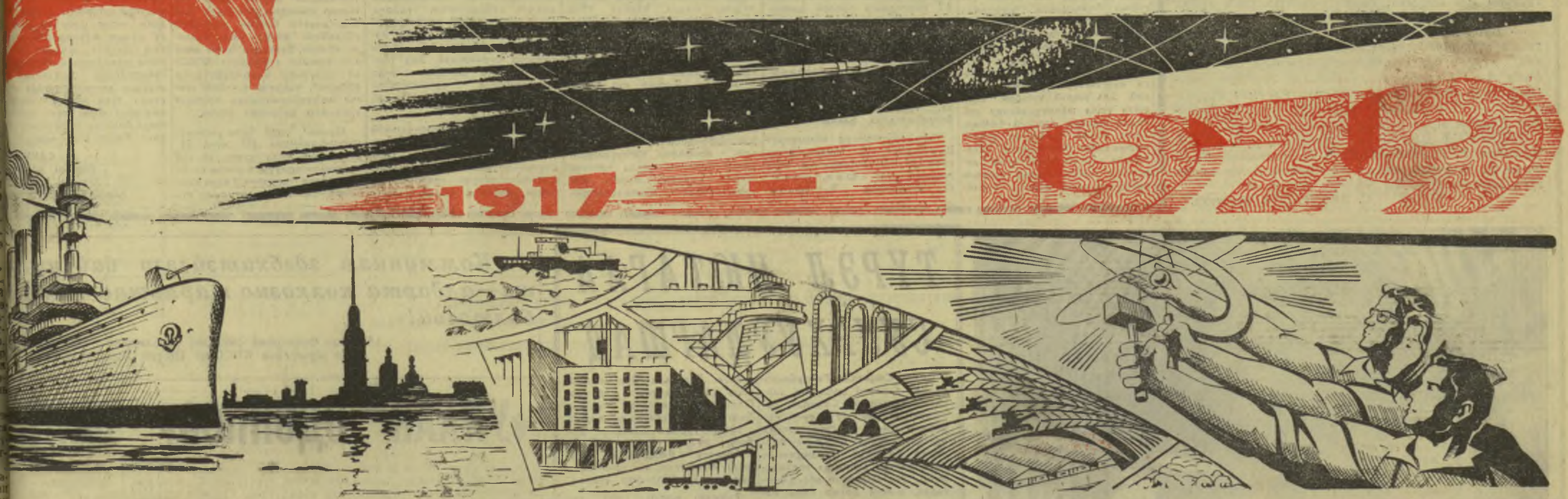
Р. АБИДУЕВАЙ зураг.