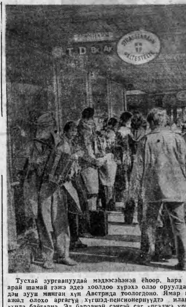
Тусхай зургаануудай мэдээсэлэнэй ёһоор, нара бүрн арай шайн гэжэ эдэс хоолоо хүрхэ өлзө оруулаг хэд-хэдэ зуун мянган хүн Австрид тоологдон. Ямар нэгэн ажал болжо аргагүй хүшад-пенсонернүүдтэ илангаа хүндэ байгана. Эд баранай сэнгэй саг үргэлжэ ургалта эдэ хүнүүдэй ажабайдыг бүришье хэсүг болгоно.

МНР. Улаан-Баатарта тоолон тодорхойлогдлын шэнэ түб нэгдэбэ. Энэ түб совет мэрэгээлэтэй тухалмажар байгуулагдаа юм.