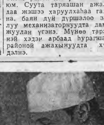
МОСКВА. Совет мэдээжэ хирург профессор С. Я. Дольский Гүрэнэй шада хуртбэ. СССР-эй АМН-эй гешүү С. Я. Дольский 373 науцна хүдэлмэри толнуулан намтартай. Энэнай ганса аргатамжын хүдэлмэри ябуулдаг бэшэ. С. Я. Дольский медицинскэ лээдэ хургуу- линуудта багшалдаг байха юм. Тэрэ эрдэмтэй 12 доктор, эрдэмтэй 58 кандидатбэ бэлдэ. ЗУРАГ ДЭЭРЭ: профессор С. Я. Дольский аргалуу- жа байхан эдир басагантай хөөрлээ.

Угтэй, нэгэ анзаһа шэрэ- хэ моритой тарашанай бүлэ- дэ түрэнэ Семён Лазаревич бага балшар наһанда нилээд юумэхиние үзэнэ ааб даа. Малшые адуулаа, тарашые ургуулаа, дархашы хээ. Октябрийн хубисхалтай ашаар 60 гаран жэлэй туршдаа ба- ян дэлгэр буряад ороной үдэр бүри хубилжэ байхан шгз шарайн хоер нодөөрөө хэ- ражэ, жаргалта байдалай тү- лөө эрэмшээ тэмдэгтэ эдэб- хитэй хабалдсанан намта- той. Семён Лазаревич Коз- лов тухай «Баатаршалга үр-