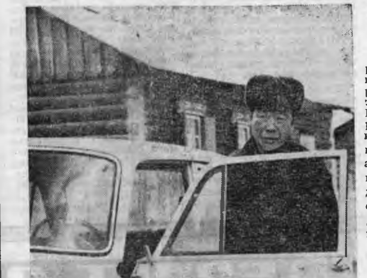
МАЛАЙ ҮБЭЛЖЭЛГЭ—ШАНГА ШАЛГАЛТА