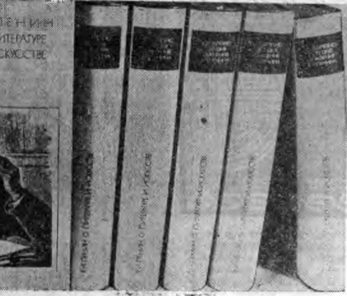
Алдарта ойе угтуулан