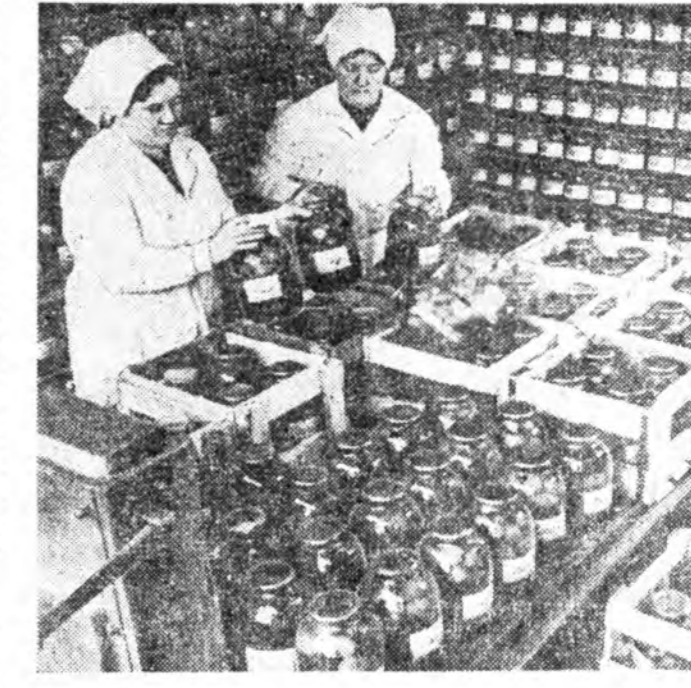
КРЫМСКЭ ОБЛАСТЬ. Красногвардейскэ районой «Дружба народов» колхоз жэлэй туршада 15 миңган тонно алим жэмэс, виноград, овоц үйлдэбэрлэн гаргадаг юм. Колхоз өөрүн консервын, аршин, тоһонэй заводуудтай, колхозинтай, таара хэдэг цехтэй, лабораторитой юм. Энэ мүнөө даһаалтын цех баригдана. ЗУРАГ ДЭЭРЭ: колхозой консервын заводто.

ЛЕНИНГРАД. (ТАСС). «Знание» бүлгэмэй лекторнуудэй бүхэсоюзна семинарда хабаадагшад Лениний теоретическэ уг баялигуудыг тайлбарлан ойлгуулдаг дүй дүршлэлүүдэ халан абалсаба. Энэ семинар «Ленинизм — манай үг сагай революционнао туг» гэхэн темэтэй байгаа.