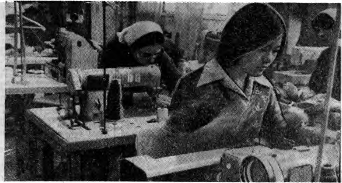
Гадар хубсаһа оддог Улаан-Удын трикотажна шэнэ фабрикын нэхэлгын цех соо.