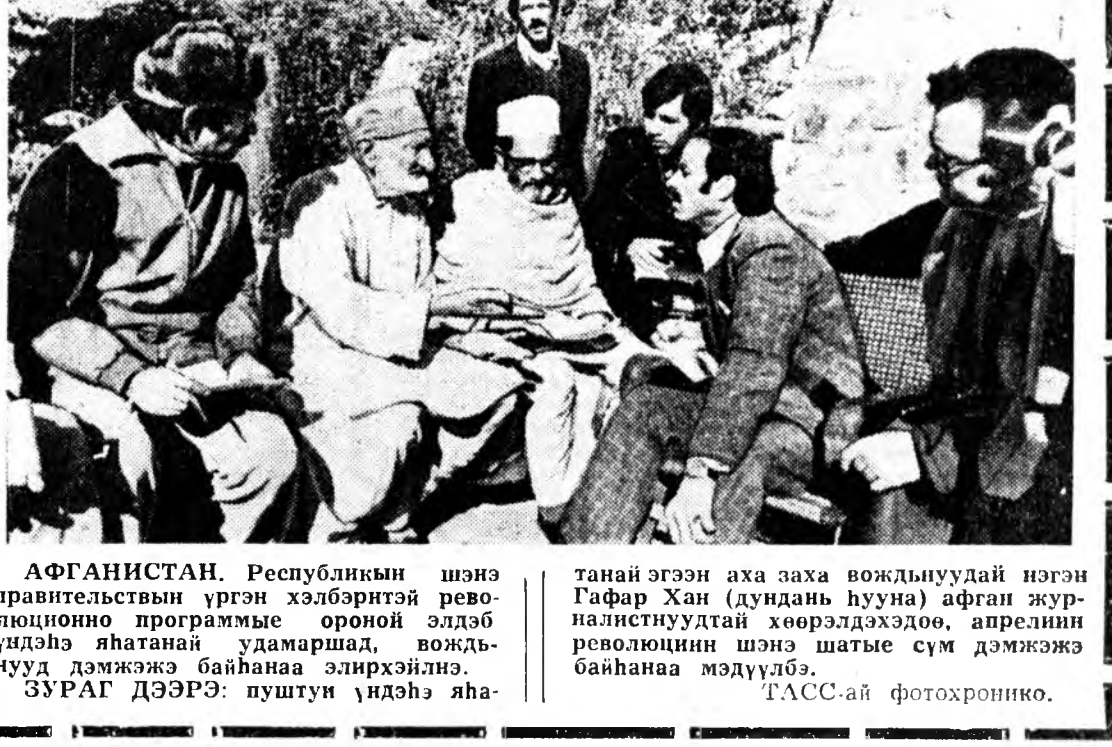
АФГАНИСТАН. Республикын шэнэ...