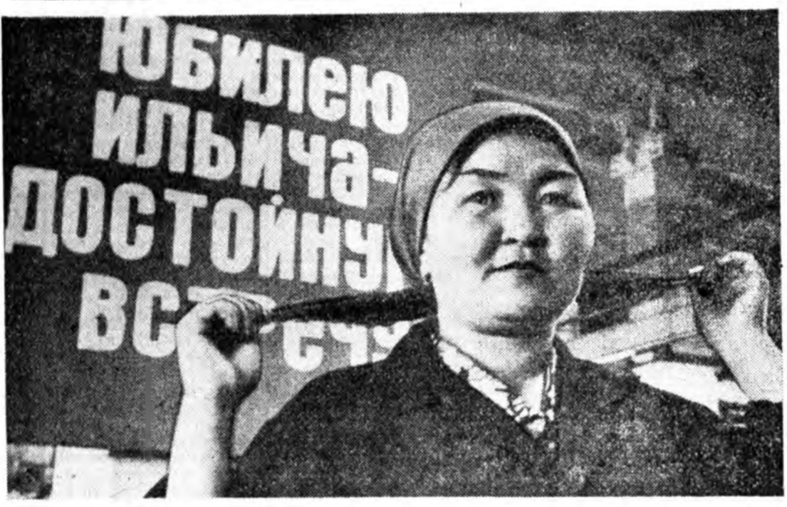
ЛЕНИНСКЭ ХҮНДЭЛЭЛЭЙ ГРАМОТАДА ХҮРГЭГШЭ