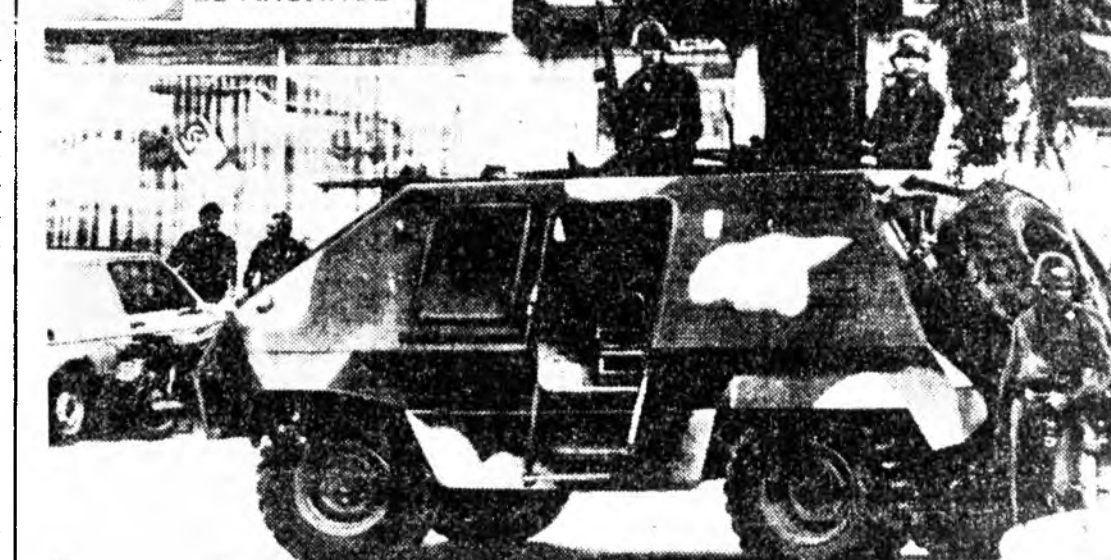
Сальвадортохи шахардуу шанга бай-даг буурангуй. Сэрэней засагаархидан ээрхэлжэ үргэлжэлээр. Хэблэлтэ мэд-сэхэлэй ёһоор, оройной инстел, бусад томо хонгуудай үйлсөөр танхтай, хуягта машинанан, автомашинанай сэрэгшэд дү-рэн. Тэдэнэр амгалан һууһан хүн зоние доромжолон хэнээнэ, нэгэлтэ хэнэ, түр-мэдэ хаана. ЗУРАГ ДЭЭРЭ: Сан-Сальвадорой нэгэ үйлсэдэ.

Хөөрөлдөөнүүдысэ хэ-хын тула А. Садаг болон М. Бегин Вашингтондо уриг-даһан байгаа. Эдэ хоёрдоһо-нууд араб арадудай аһа тү-һыс хангаха юм гэһон США-гай эрмэлзлэхэ бэшэ, харин США-гай правителствын по-литикэсэ харна бодоһоно үндэһэтэй байна гэжэ тэрэ хэлэбэ.