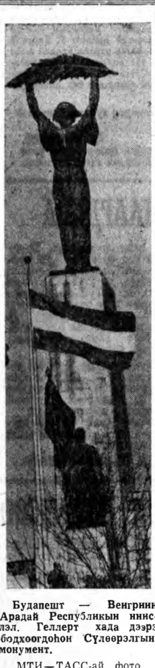
Будапешт — Венгрийн Арадай Республикын нислэл. Геллерт хада дээрэ бодохдогон Сүлөөрэлгын монумент.

БЕРЛИН. «Байгаалин ба тэрэний оршонине хамгаала» гэж нэрлэгдэнэ шэнэ бүлгэм ГДР-тэ эмхидхэгдэб. Байгаалин байлигууде арад зоний аша туһада үрэ эхэтэйгээр хэрэглэхэдэ энэ бүлгэм горитой нүлөө үзүүлхэ юм.