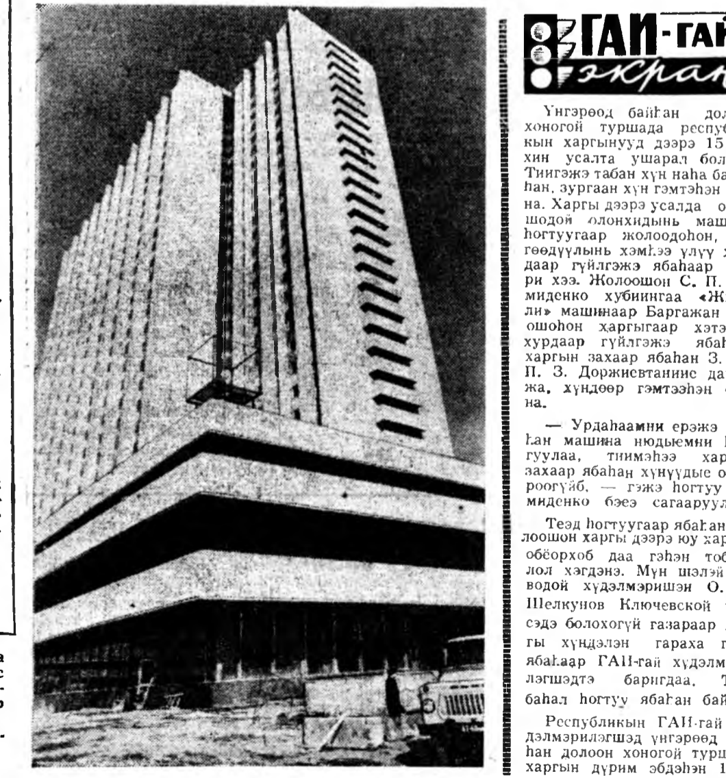
Урдааһанни эржэ ябан машина нодьмийн харгуула, тинмээшэ харгын захаран хуһууды обороогүйб. — гэжэ хотуу Деменко бөөэ сагааруула.

Вольеболлоор республикын түрүү нуури эзэлхын түлөө мүрүсөөн Бурядай мебель бүтээгдөг, модо болбосоруулдаг комбинатай спортзал со боложо байна. Эхэнэрүүдэй найман, эршүүдэй арбан нэгэн суглуулагдамаг командан энэндэ хабаадана.