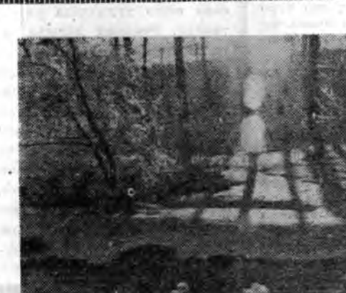
«СПОРТЛОТОНУУДАЙ ТИРАЖАЙ ДҮНГҮҮД»

Харанх жалга — Тайгын оёрто Хабар үшөөл эрээгүй шонги. Харяалан урдаан Горхойно эрбэдэ Харана гүт — Саха мурьба...