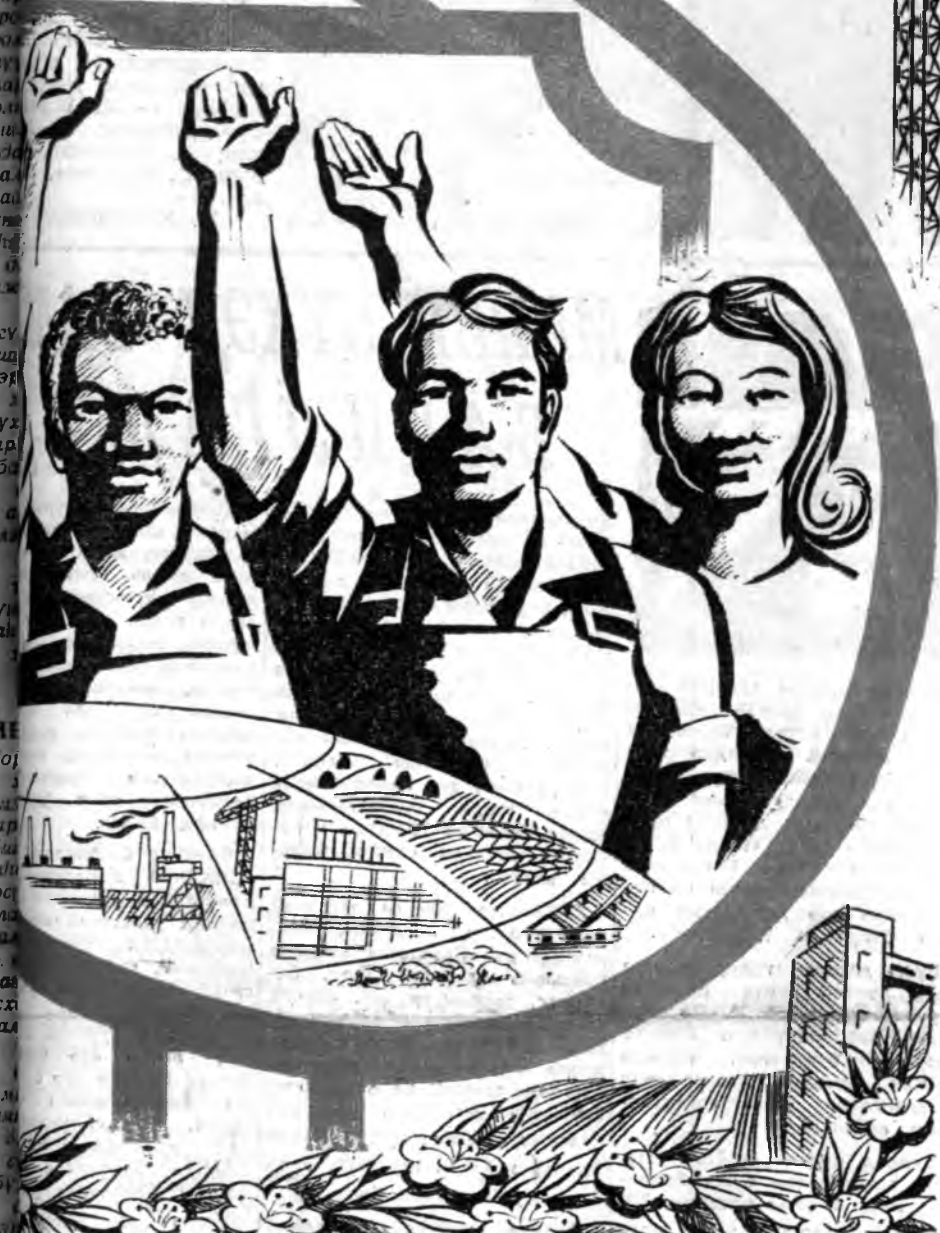
Р. АВИДУЕВАН зураг.