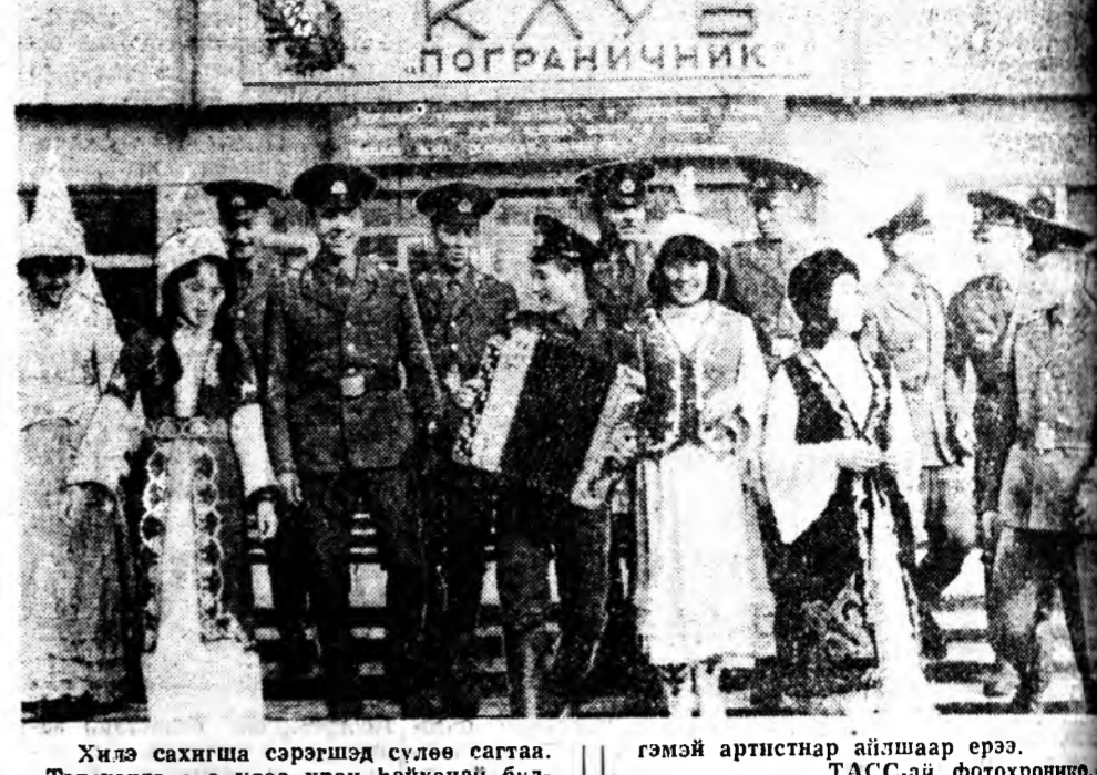
Хилэ сахижа сэрэгшэ сүлөө сагтаа. Тэднэртэ энэ удаа уран байханы бул- гэмэй артистнар айлшаар эрээ.

хэлсэдэг. Республика дотороо мэдээж болсон Хүшгөөрэй, Аллын, Гааргын аршаанууд тухай хэдэн үгэ тогтон хэлэлтэй гэжэ һанагдана. Хүшгөөрэй аршаан газарай хүрхэ хэдэн тээ соолон оодоо сорьёо, секундын туршдаа 10 — 11 литр үнэ гаргадаг юм. Уһанай температура 21-һээ 75 градус хүрэтэр халуун байдаг. Химическэ бүридэл тухайн хэдэхэ боолоо һаа, аршаанай литр уһандаа 29 миллиграмм сероводород бии гэжэ тэмдэглэтэй. Тимэһээл энгэри шабарай эмшлэгийн шайнараһаа нүлөөн тухай онсо