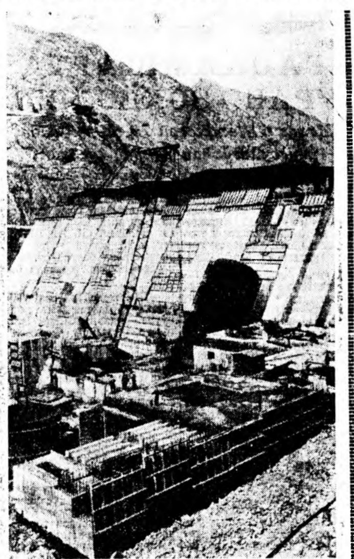
«1976—1980 онуудта СССР-эй арадай ажахы хүгжөөх гэдэ шалгэлдүүд» дотор заагданай ёһоор Нарын мурэн дээрэ Курсайска ГЭС баригдажа байхай. Тэрэний плотинода 360 мянган кубометр бетон шудагдаа. Энэ жэлэй нүүл багар станциин түрүүшүн аргават электрын элшэ хүсэ үгэхэ юм. Энэ мурэн эрвэдэ Киргизидэ эгээ залуу Кара-Куль город урган бодонхой. ЗУРАГ ДЭЭРЭ: Курсайска ГЭС-эй плотинын барилда.