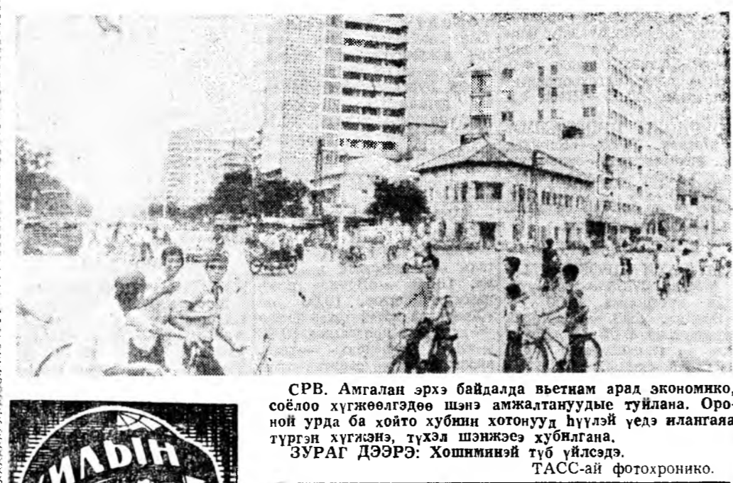
СРВ. Амгалан эрхэ байдалда вьетнам арал экономика, соёлоо хүжөөлөгдөө шэнэ амжалтанууды туйлана. Оро-ной урда ба хойто хубини хотонууд нүүлэй үдэ илангата түргэн хугалээ, түхэл шонжээсэ хубилгана. ЗУРАГ ДЭЭРЭ: Хошиминэй түб үйлсэдэ.

ВАРШАВА. Шила хотын ломотивна дело Польшын аруун-хойто хубини түмэр амуудай хэрэглэмэдэ бин байхан бүхэ теллоозуудта капитална вахабарилга хэрэ-гилгэ бэс дээрэ даажа аба-на. Ороной түмэр замшад бу-с делогой энэ үүсхэлые үн-дэрөөр сэгнээ. Үнхөөрөөшье, теллоозууды ороной бусад районууд худар абаашаха хэр-эгтэ гаргашалагдадаг эхэ мүн-гэ зөөри алмагдахан бшуу.