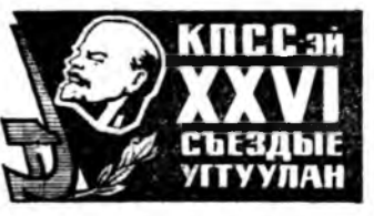
КПСС-ийн XXVI СЪЕЗДЫН УГУУЛАН