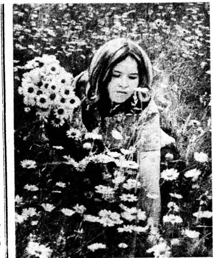
Һэрюүхэн нэһшээд хээсэдшэ сэнгүүл, Зунай саг зугаалха хүхюул...

Мэдээжэ поэт Евгений Александрович Евтушенко нажар бүри совет оройнойго ямар нэгэн эхэ мүнөөндө эхнэрэй аяаг хүрээтүр тамардаг заншалтай юм. Мүнөө жэлдэ Монголой Арадай Республикын газар дээрэ эхн абтагд Сэлэнгэ мүнэнэй тэрэ урууджа яһана. Хэр уһаа хойшо түүхээр баян Хяагта хотын олонимтэ суута поэдые угтажа улаһан байна. Евгений Евтушенко Хяагтын хизаар сороһоо шэнжэлтын болон Монголой арадай революционн музейнүүдтэ оройно, түүхтэ бусад газарнуудтайнь танилсаһан байна. Үдэшлэн уран зоһолой эхэ үдэшэ зардагдажа, соёлой байшан соо хүн зон багтажа ядарааа сугларба. Поэзилэ дуртайшуудда Е. Евтушенко дүлэтэ шүлгүүдэ уһнаһад, хэдэн олон асуудалнуудтань харюусаа. Манай корр.