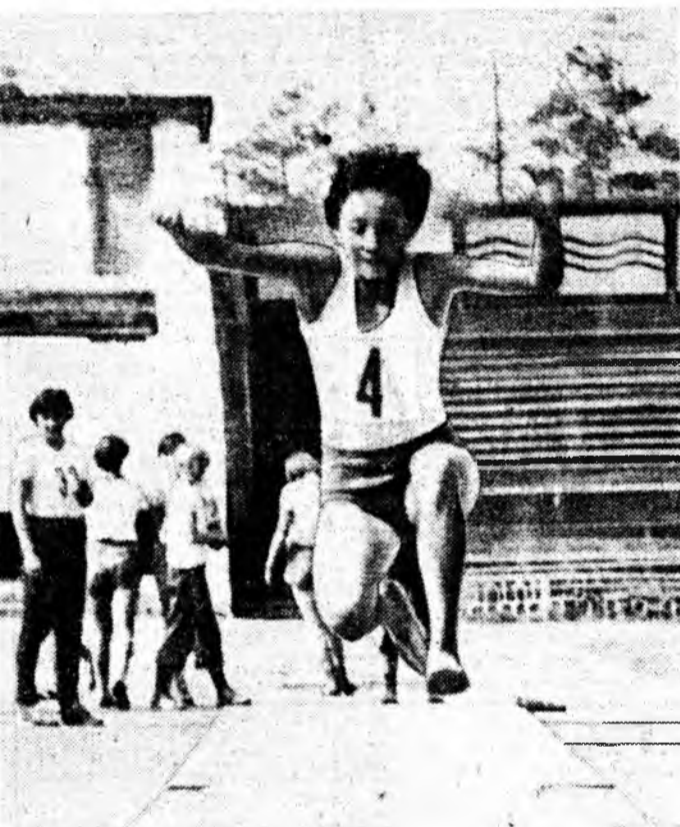
Ураг дээрэ: мурьсоон- нэй уеда.

Юуб гэхэдэ, энэ жэлдэ Пет- ропавловкын дунда хургуу- ли дүүргэнэ Юрий Гри