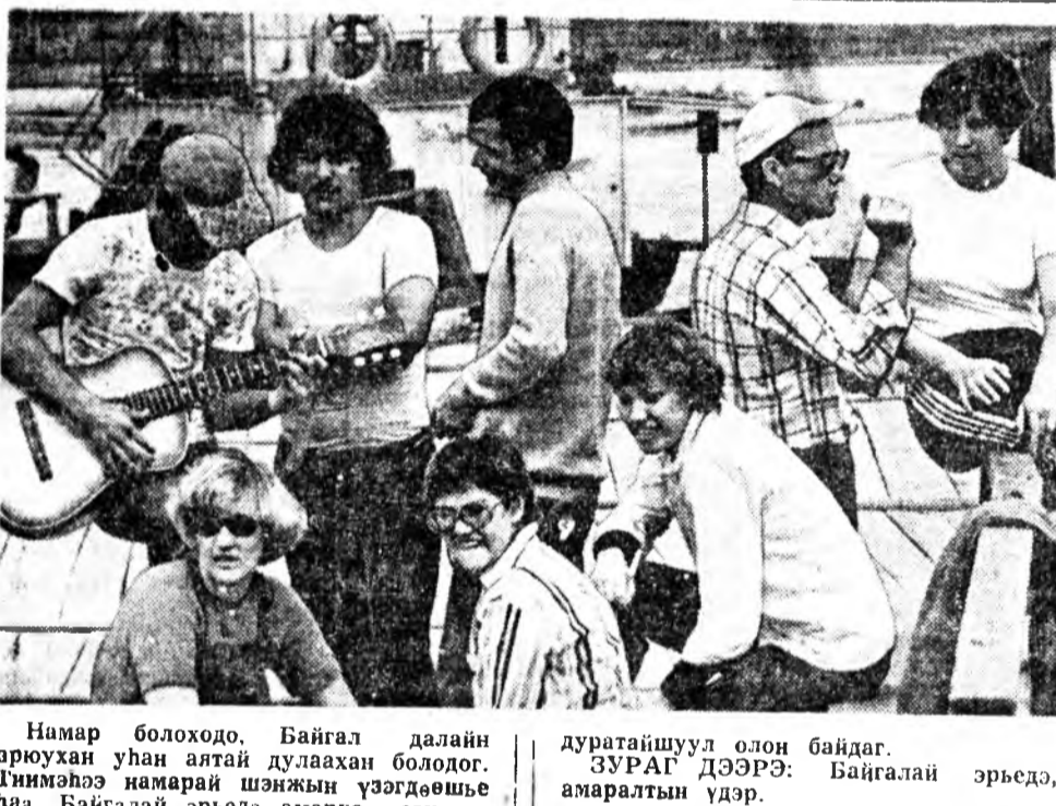
Нимар болоходо. Байгал далайн арюухан уһан аятай дулахан болодог. Тинхэлээ намарай шөнжын үзэгдөшөө хаа, Байгалай эрьсэд амарха, сэнгэхэ дуртайшуул олон байдаг. ЗУРАГ ДЭЭРЭ: Байгалай эрьсэд, амаралтын үдэр.

Иймэ гаршастай «Будамшу» байгша оной июль харын 12 то манай газетэдэ толгойлодон байгаа. Улан нотагта түрүү ажалараа алдаршан хүдэлмэригээр бэрхэ хү-нүүд олон юм. Тээд жэлэй туршада талалгааргүй найнаар худалдэ, тон зүбөөр тооложо тодорхойлодон түлбэриэ тэвшин олоонхи хүсдөөр абдагай байшоо.