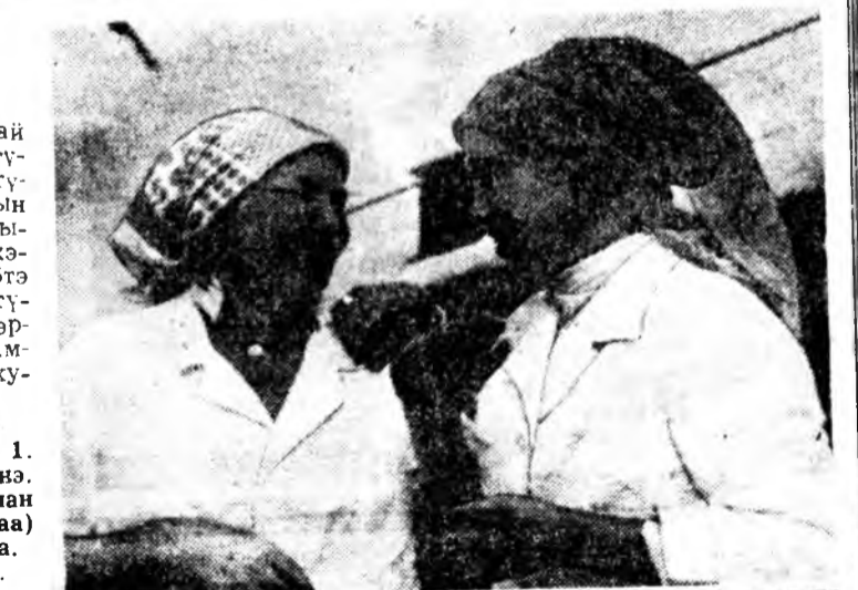
Ц. ЦЫБИКОЕ. КПСС-эй обкомон секторые даагша.