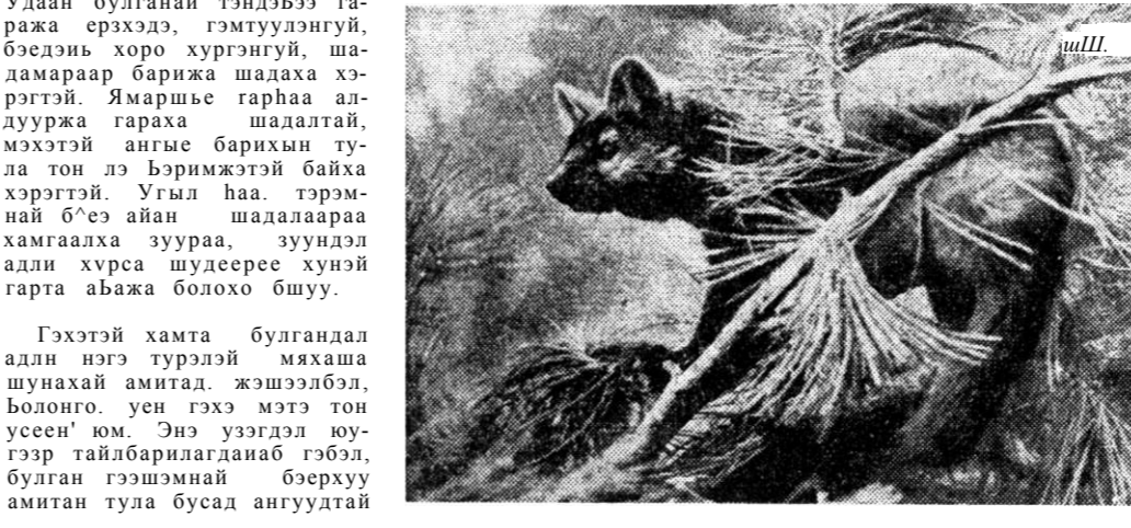
«атаа мэрэхэдэн», тэндээр тэ амар заяа узуулдэггүй. Ха-яа охотонтой, хулгай-ша ба дээрэмшэ шулууйнтэн ушаржа боломоор. Шэлуу-бэн гэшэмнэй бунг, ханда-гай, оро гэхэ мэте тон лэ бээлээр динээн аларжаридат. Галда заповеднигтэ халоон, бабгай, оро, буга, хуэри, хэрмэ, тарбаган хээл мэртэ ажамилардаг. Тинхэдэ амита-дай хоолойе бажуужа.

Гэхэтэй хамта булгандал адли нэгэ туралэй мяхаша шунахай амидат, жэшээбэл, Болонго. уен гэхэ мэтэ тон уесен' юм. Энэ үзэгдэл юуг-гээр тайлбарилгандиба гэбэл, булган гэшэмнэй бөрхуу амгитан тула бусад ангуудтай