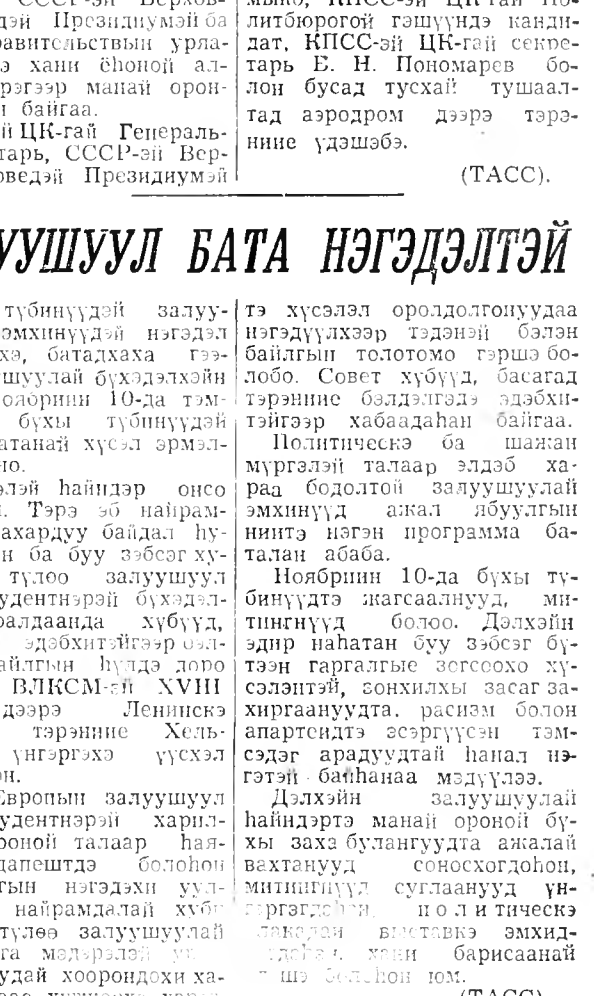
Угарага мүнөө эхилнхэй. Тэрэндэ манайшэ ресс...