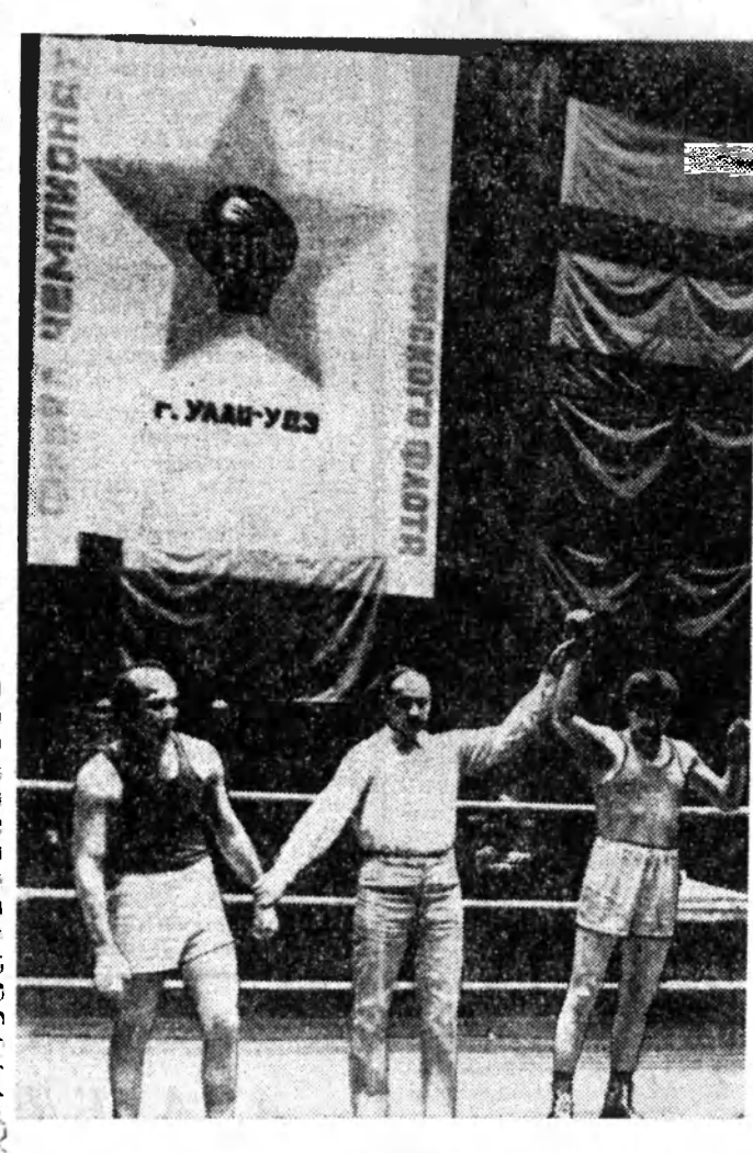
Мурьсоонэй гурбадахы үдэрэй уулзалганууд... Үнгэрэгдөөд байхан наадануудай үдэр үдэрэй дүн хаража үзэхэдэ, шүүжэ эхилхэн боксернуудын туйлаан амжалтаа улам гурбадахын, харин үүгдэгдэдын удаадахи уулзалгана хабаадалсаа эрхэдэ хүртэхын түлөө эрмэлзэнэ. Юуб гэжээ, нааданай гуримай