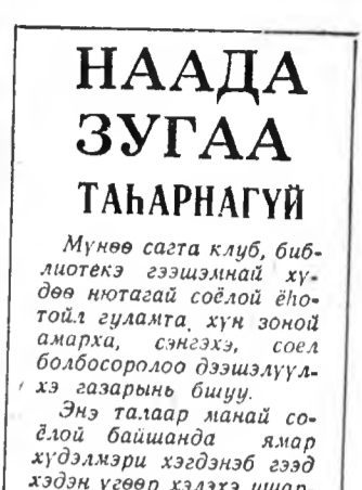
Хүн зоний, илангаяа хүдөөгэй хүн зоний гэр байрын ба Ажабуудалай эрхэ байдал найжаруулха, гэгэй ажал хүндлүүлхэ.