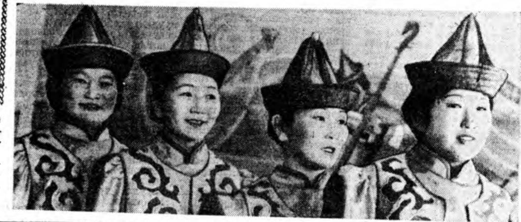
Совет хүнүүдэй үзэл бодол, оюун бэлиг, соёл болбосоролыг дээшлүүлхэ, хүмүүжүүлхэ хэрэгтэй парти, правительстванай тон эхэ анхарал хандуула.

Хүн зоний, илангаяа хүдөөгэй хүн зоний гэр байрын ба Ажабуудалай эрхэ байдал найжаруулха, гэгэй ажал хүндлүүлхэ.