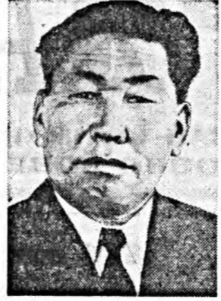
Эдэ бүтэдэ цөхэй партийна организаци болон парткомий ханаа ехэ зобоон байна.