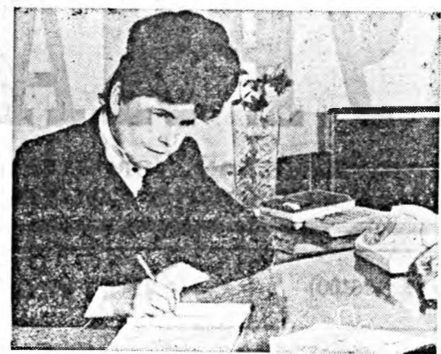
хээрлэгдэ, болбосон түрээсэй боллогод мунгэ эригдэ...