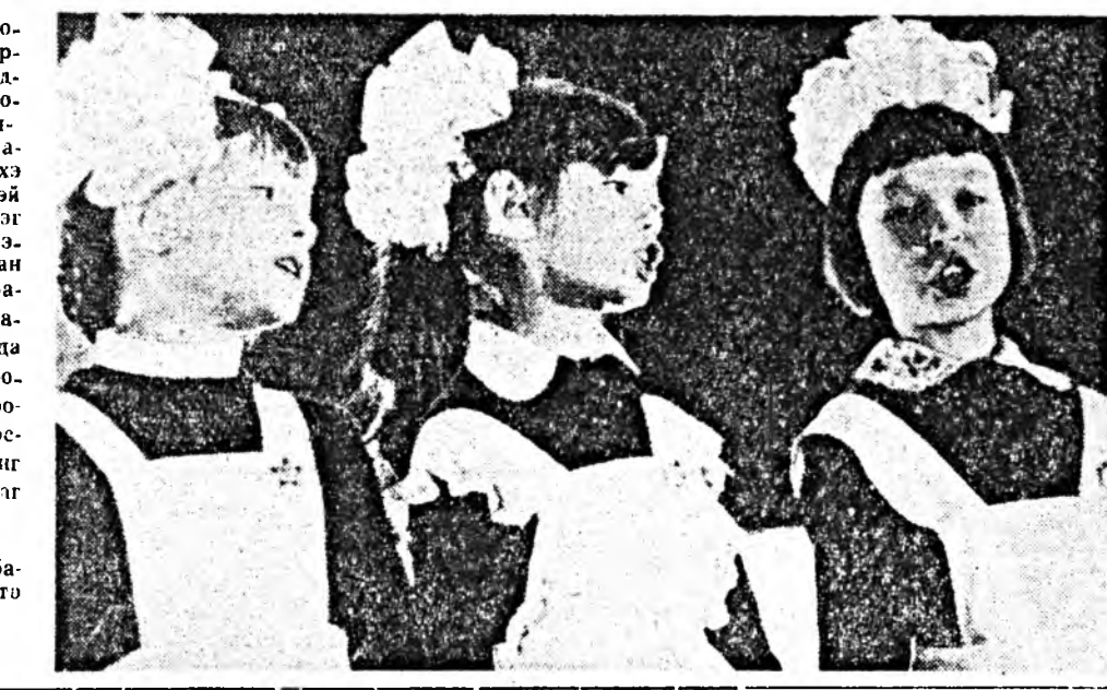
ЗУРАГ ДЭЭРЭ: эгэл ба-га наһагшүүдэй хоорто хабаадлсагшад.

Улаан-Удын шэлэй зав-дой соёлой байшангай дэр-гэдэ үхнүүдэй клуб эмхи-дэгдээр үнэйрэй юм. Заво-дой хүдэлмэришлэй үхи-бүүдые гоё һайханда һури-аха ашаар аюуладала. Хүүгэлэй клубай дэргэдэ худалдаа хоорто эдиршүүд дуунай шад-тай танисадаг, һураһан дууга түрэлхэйнигөө, аха за-ха нүхэлэйгөө урда дуулаха-даа, магтаал, һайшаалда хүртэдэг юм. Гадна энэ хо-орой үхнүүд районий, гөр-дой харалгануудта, конкур-суудта хабаадлсажа, бэлгэ шадабарияа түршэлсэдг байна.