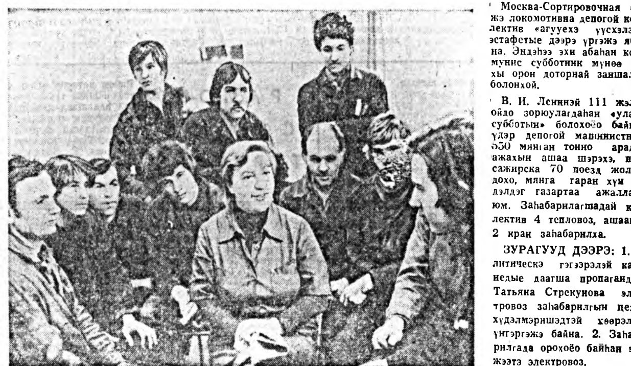
Москва-Сортировочная гэжэ локомотива дөговой гал-денте «Агууехэ үүсхэлэй» эстафетэ дээрэ үргэжэ аб-на. Эндэнэй аман абан ком-мунист суботкин мүнөө бү-хы орон доторнай зашлалта болонхой.

В. И. Ленинэй 111 жэлэй ойдо зоруулагдахан «Улаан суботкин» болохоно байгаа үдэр дөговой машинистээр 650 мянган тоноо арадай ажахын аша шэрээ, вас-сажирска 70 поезд жолоо-дох, мянга гурган хүү хүд-лэдэг газартаа ажаллаха юм. Заһабарилгадай коллектив 4 тепловоз, ашаанай 2 хан заһабарилга.