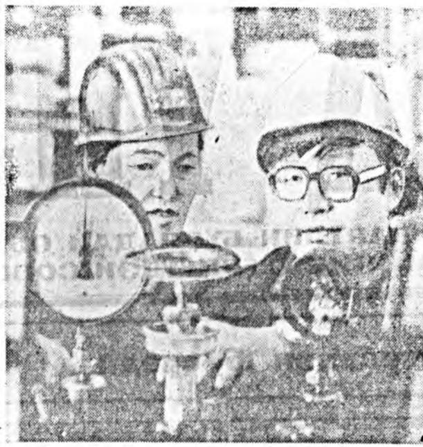
Улаан-Удын ТЭЦ-эй коллектив залуу үстэнине хүмүүжүүлхэ талаар ехэ ажал ялуула. Ажалал ветеранууд болон курган хүмүүжүүлгээ залуушуудла мэргэжлээ шуудалхадан туна хүр-гээг заншалтай юм. Манай шатандаш фот о корреспондент П. Бурмакин зураг дээр ажалал ветеран