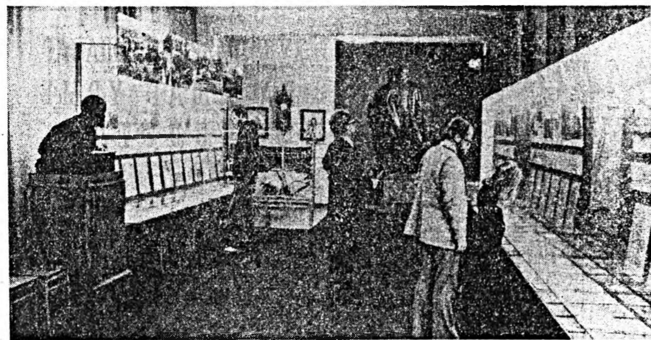
Владимир Ильич Ленинэй намтарай эхэн хуби Финляндият нягта холбоотой. Тэрэ энэ орондо оло дахин ерэн байнашье юм.