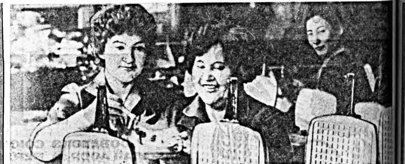
Улаан-Удэн локомotive-вагон заһабарилгин заводто ардад урэн хэрэглэйгэ 24 ондоо яжин бүтээлүүд үйлдэрилэгдэн гаргадаа. Энэ жэлд ардад урэн хэрэглэйгэ дэ баранай чехтэ 1,450 мянган тухэрэйг, тикхэдэ арбан нэгдэхдэ табан жэлэй туршада 7,738 тухэрэйг продукция бүтэн гаргадаа юм.

Турүүлэй худэлдэрин үдэр тухай. Дэб дээр тэрэ найнаар эмхидхэгдэн гэжин аргагүй. Энэ инструкторуудэй гэмээр болоһон ушар бэшэ.