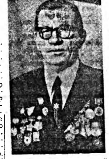
ген хүмүүжүүлжэ, ажалай аруун харгыда гаргана тавилан намтартай. Мүнөө тэрэ ДОСААФ-ай эхнэр эмгийн туруулгыгээр хүдэлжэ ябадаг сэргэй-патриотическа, оюонын асуудалдар хүмүүжүүлгын, ойлгууламжын эхэ хүдэлмэри ябуула. СӨТНИЧ, дайны, ажалай ветеран.