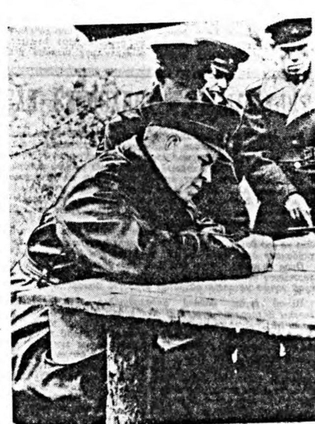
Советскэ Союзай Маршал Г. К. Жуков командант ТАСС-ай фотохронко, (АПН).

Бүтэдэ арадай дурлалда хүртэһэн, анхарал оролдогдоор хүрээлэгдэһэн совет сэрээтэд социализмын ба эб найрамдалай тулалтаныудыг үнэн сэхээр сахиха гэдэг патриотическа, интернациональна уулгажа нэрэ тэй солотойгоор бэлтгэлжэ байнал.