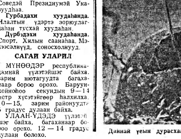
Даннай усын дурасхаа. Фото-буулабары.

ГРАВАДА БУРЯТИИ Советэй Президиумэй Указуудһаа. Гурбадахин хуудананда.