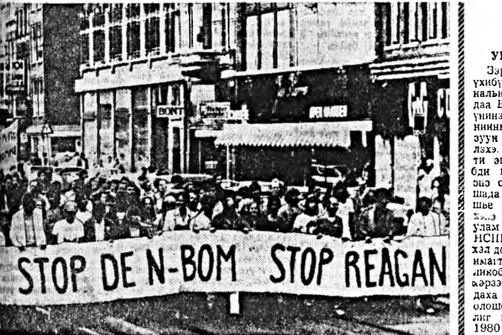
STOP DE N-BOM STOP REAGAN