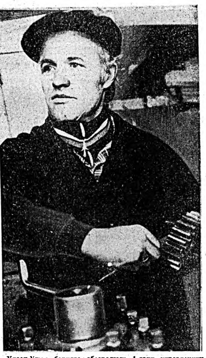
Улаан-Удын барилга-хасбаралгын 1-дэй управлениин коллективэй хүдэлмэришдэй хээгүй ажал байхагүй. Хүдөөгэй болон хото гороудай олонхы барилганууд тэдэнэрэй хабаадлаагар бүтээгдэнэ.

Мүнөө дурсагдаһа ажахь хониншод түл абаалада гол түлэб бэлдэжэ дүүргэжэ байна. Эхэ хонидой хото, хөрбө, малшадый гэр байрланууд дулаалагдажа занабарилгадхай. Эндэх малшад хони, хурьгадйгаа до ро дэбдихэ хохир хүсэд хүрмүүөө бэлдэжэ абаа юм. Мүнөө тэдэ жэжэ-божо дугарданууда асауджа, хэрэгтэй зэр эмсэгээ бэлдэнэ.