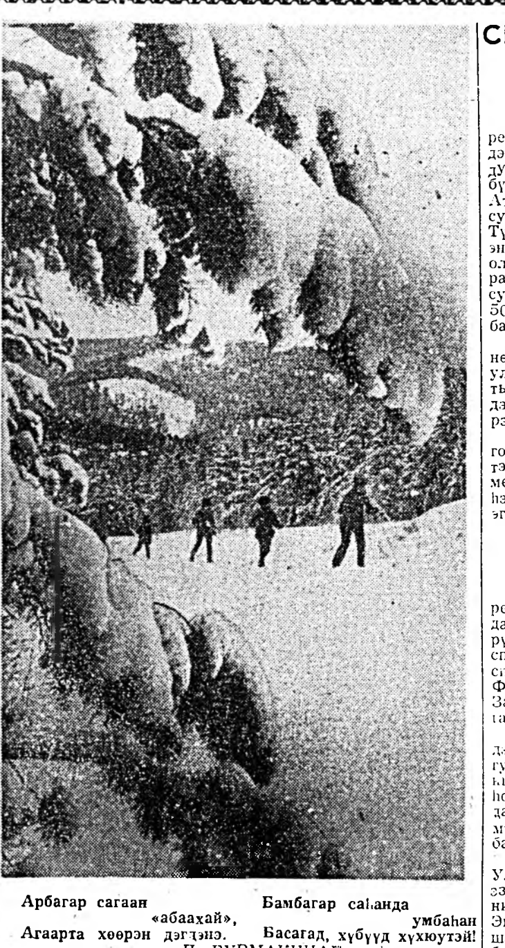
Арбагар сагаан «абахай», Бамбагар сагаанда умбаган Агаарта хоёрон дэгтэнэ.