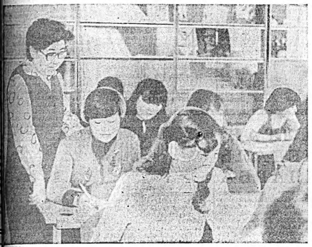
Харин тийхэндэн Сэлэнгын районий Юрөгэй дунда...