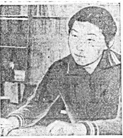
Хүннүүдэй болохо гэжэн түрэлхин бэлитгэй хүн гэлсэжэбди.