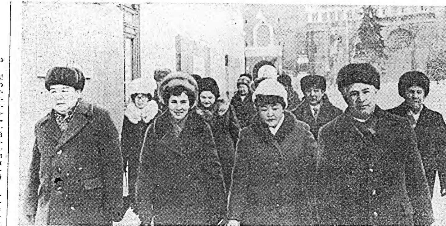
ЗУРАГ ДЭЭРЭ: СССР-эй ПРОФЕССИОНАЛЬНА СОЮЗУДАЙ XVII СЪЕЗДДЭ БУРЯДАЙ АССР-НЭЭ ОШОБОН ДЕЛЕГАДУУД КРЕМЛИИ ДЭРГЭДЭ.

дүүдэйнгэ түлөө, худалмэришэн ангийн тэмдэглэе элэнгэ сэхэ туулаа. Хүндэ Л. И. Брежневтэ элэнгэ сэхэ туулаа тэрэ энэ хүндэтэ шагнал хайрада хүртэбэ. Профсоюзудай Бүхэдэлхэйн Федерацийн Алтан медаль Шандор Гашпар съездын трибунада гараба.