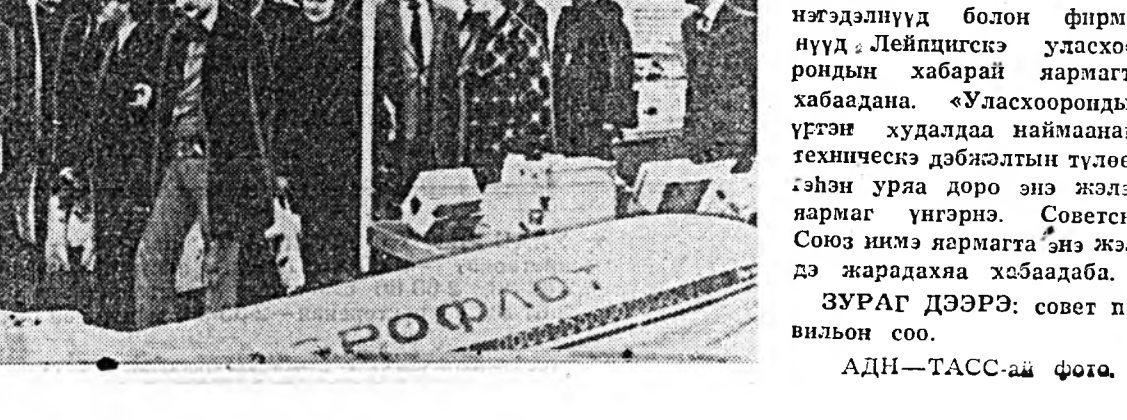
ГДР. Дэлхийн жар гаран оройн, тэрэ тоодо Советскэ Союзай промышленна 9 мянга шахуу предпритий, гадаадын худалдаа наймаанай нэгдэлүүд болон фирмэ гэдэнэ. Лейпцигтэ улсхоорондын хабарай лярмагта хабадана. «Улсхоорондын үгтэн худалдаа наймаанай, техниктээ дэбжэлтын түлөө» гэдэн урда дор энэ жэлэй лярмаг үнэгэнэ. Советскэ Союз нима лярмагта энэ жэлдэ жардахаа хабаадаба. ЗУРАГ ДЭЭРЭ: совет лавильон соо.

Шанга ба арсалдаа буялалдагтай улсхоорондын уршагта хэрэгүүдэй дунда Кариска бассейндэхи ба Америкын түбтүхи байдал түрүү буурида гаража байна. Энэхэй байдал яаха аргугүй орбо болонхой. Дэлхийн Энэ региондох байдалтай холбоотойгоор Вашингтондоо хэлэгдэж, хөгдөж байхан бүхэй аюулга нима нэгэ юмэ гэршлээ. Рейганэй захиргаан интервенци хөжэ йоадалда найлана, тэрэндээ эдэхэй эхэтэйгээр бэлдэж байна. Бодото дээр абахаа интервенци хэрэгдэж эхилдэггүй. Куба ба Никарагуагай эрье шадар харата зорилгоо далайн-сэрэгэй манер хэдэнэ. ПРУ-гай туналмаанаар Никарагуада эсэргүү харис ябуулангууд эмхидхэгдэнэ. Энээн тухай американ хэлбэл сэхэ бэшнээ. Эдэ гүрнүүдтэ довтолгон оролдоо американ сэргүүд эдэхэн эхэтэйгээр бэлдэнэ. Энэниине болоолгы президент Рейган ба гүрнэй секретарь Хейг эрид арсана гэжээ.