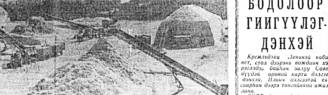
ЗУРАГ ДЭЭРЭ: Ашхабадская областини Каакинская хлопок себарландын заводой бэлдэхэй талмайнууд.