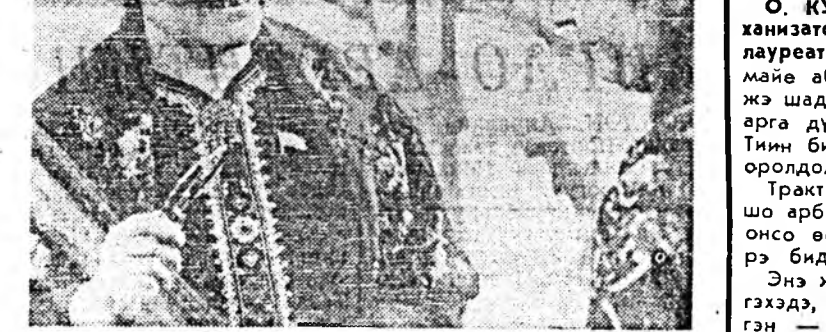
ЗУРАГ ДЭЭРЭ: Ашхабадская Дзержинский нэрэмжтэ пумаажан бүдэй комбинадий профсоюзной комитетэй туруу...