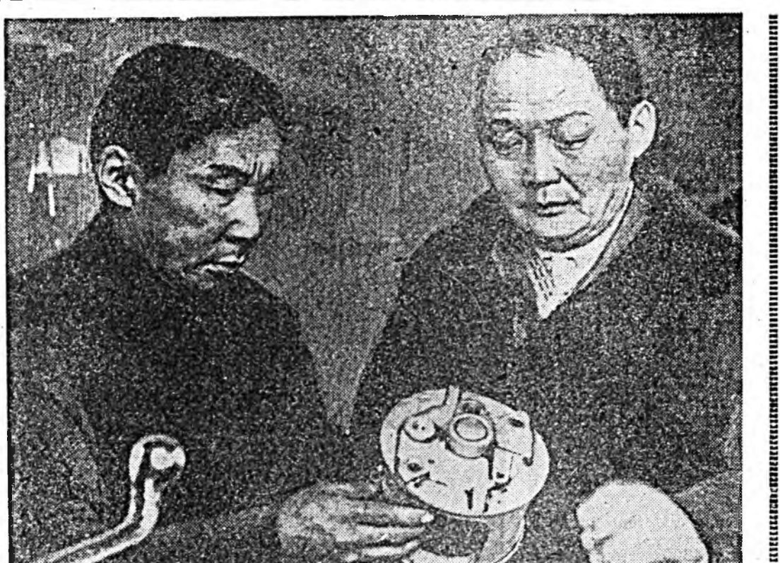
Арбан нэгдэх табан жэлэй хоёрдох жэлдэ Здын районий «Мир» колхозой механизаторууд орооно тарнаан, тэжээл ургамалуудтай тогтруури байн ургаса заабол ургууулын тула хабар тарилгада хабаауулагдажа машина, техникэ заахарилдаа, түгээ бэлдэхүн түлээ шарийн ороолдоно. Мүнөө ажакын мастерскийнууд соо заахарилтын худалдэриин түлэг дундаа.

Ургасан ба адууна малай ашаг шэвхэн бага дээрнээ, малай фермнүүдэй худалдэриин үргэлжлэжэ онгожооруулагдаггүйнө, тэндхи техникни муугаар ашаглагдажа байнанаа, ажалай эмхидхэлэй ба ажалай журам хуудалын хайжаруулха талаар районий партина организациин зорилгоуд тухай асуудал зүбшэн хэлэгдэбэ.