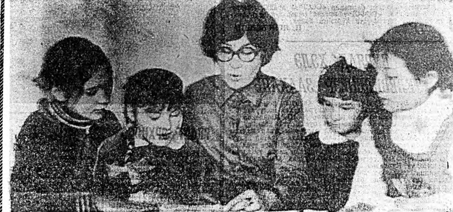
П. И. Чайковскийн нэрэмжит Улаан-Үдэн хөгжмэлчүүдийн үйлчилгээний дүүргэд, арбаад... Сергей МИХАЛКОВ