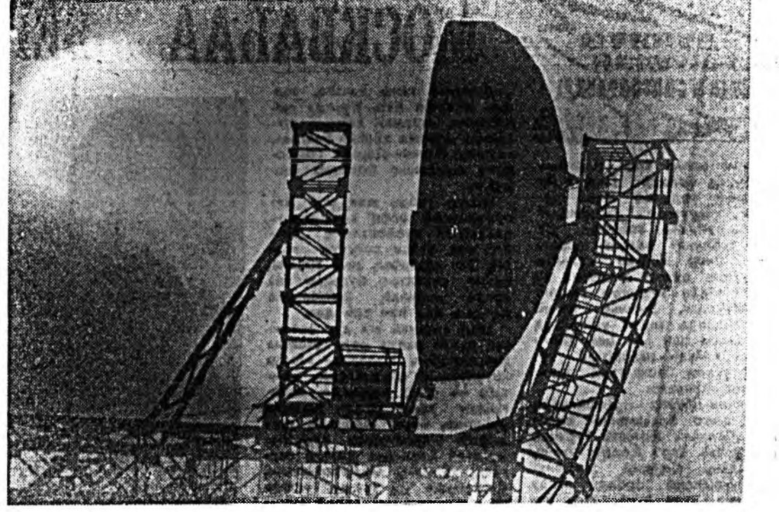
Сэлмэг нартай үдэрнүүдээр олон байдгай нутагуудад геологичид шэнжлэл бэдэрлэлийн ажлыг эхэлж байна. Архивийн хөдөлгөөнийг тусгаж авч ажиллаж байгаа нь харагдаж байна.

Энэ шэнж арга Сибирьт туршигдан байна. Шэнжлэл бэдэрлэлийн заншлыг боловсон ажилтануудтай хамта энэ шэнж аргыг тааралтай ажиллагаанд оруулахаар төлөвлөж байна.