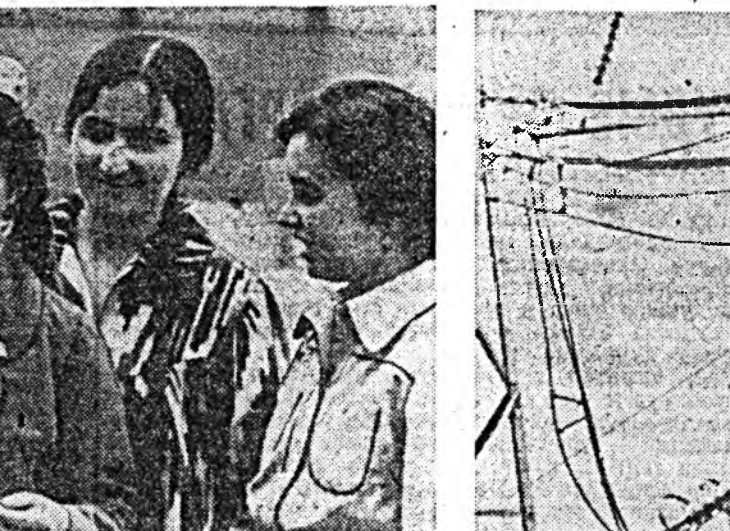
СССР-эй арадуудай эбтэй эгэтэй булд дотор Таджикгай ССР эхэ амжалтануудыг туйлана. Тингэжэ Таджикгай ССР-тэ экономика, социальная болон бусад асуудалуудууд эхэ амжалта туйлагдаа.