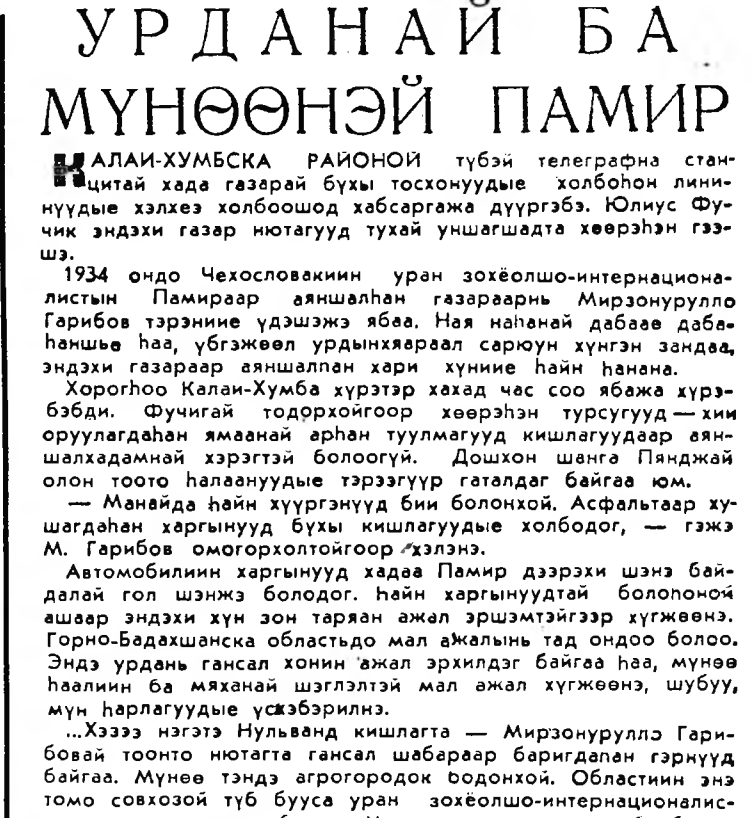
УРДАНАЙ БА МҮНӨӨНЭЙ ПАМИР АЛАИ-ХУМЕСКА РАИОНОЙ түбэй телеграфна стан-циятай хада газарай бүхэ тосхонууде холбоһон лини-нуудые хэлжэ холбошоод хабсаргаа дүүргэбэ. Юлиус Фучик эндики газар нотагууд тухай уншашадта хөөрэнэ гээшэ.

Таджикгай ССР-эй Гүрэнэй шангай лауреат. 20 академическэ институт-дай хүдэлжэ таджик эрдэмтэй-дэй хуби занитай тэрэнэй хуби занан адаи юм. Эдэ ин-ститутууд аха дүү бүхэ рес-публиканиудай наука түбүүд-тэй холлоо барилгатай. Ган-сахан үмгэрлэн жэлдэ эндэ шүрбан миллион түхэрнэй на-учна хүдэлмэри хэдэлэн байна.