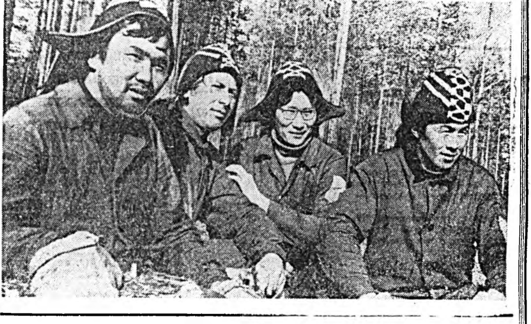
Барилгын материалнуудаар гүйсэд хангаа

Иинэ зорилго Зэдэн комбинатай барилгын материалнуудай хөхэй хүдэлмэригэд урдаа табиба. Харалган эрилдоодоо хүрэн гэжэ хэтээрэ. Тинн, байгаа оной табан харн түсэбтэ 102 процентээр дүүргэ.