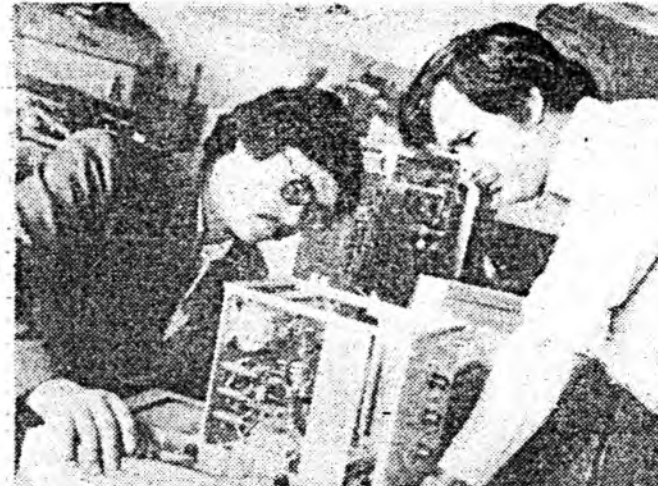
Хүний биеийн эрүүлжүүлэхэд орлоо түхээрэлгэнүүд хэрэглэгдэж байна.