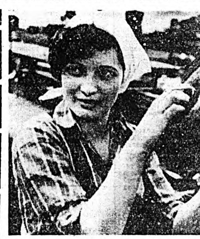
Улаан-Удын Лениск комсомолой нэрэмжэт нэри...