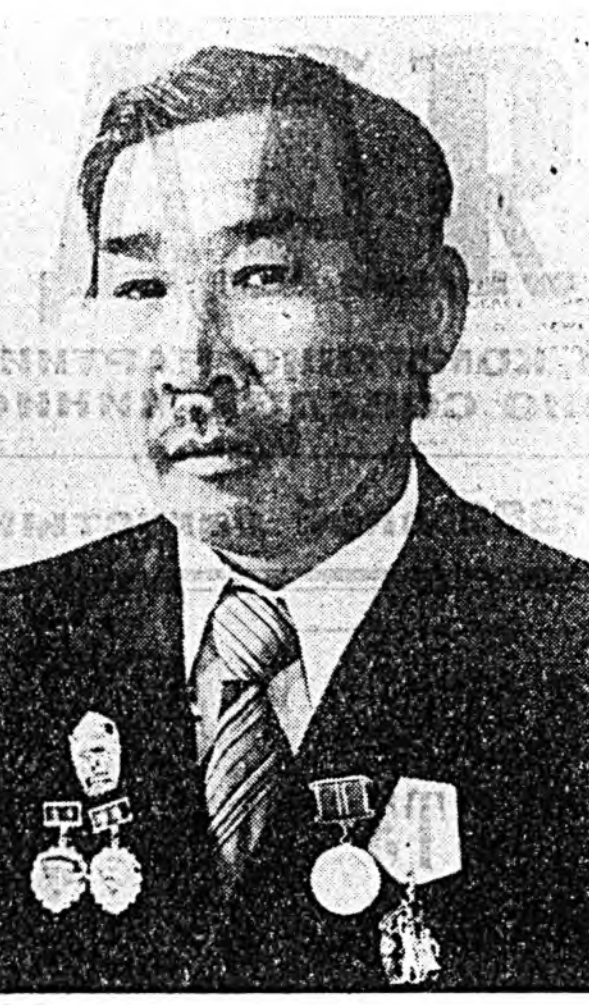
ТАБАН ЖЭЛЭЙ ТУРУУШУУЛ КПСС-ЭЙ ГЭШҮҮН БУДА САМБУЕВИЧ ЮГДРОВ...