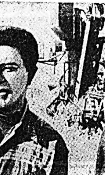
Хуряалгын үдэ эмхидгэдэ социалист мурысөөнэй гүрмн эртүүр зохиогдонхой, баталагданхай, механизатор бо-

Тарья, хартаабыа ошц хуряалага Заганай колхоздо, «Эрдэм» совхоздо нилээд ургашат абажа байна. Гөбшө, районной бүхнэ ажахынуйдал ургаса хуряала эмхитэй һайнаар ябана гэжин аргатай. Хуряалгын хүдэлмэри зохио сагай ошоогшэ байбашые, район соо тарьяан бүхнэ тарьянай хадгаланы арай эхэ гэхэ тү, али гүшад мянган гектар унагаагдаа байн.