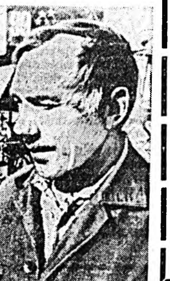
Хуряалгын үдэ эмхидгэдэ социалист мурысөөнэй гүрмн эртүүр зохиогдонхой, баталагданхай, механизатор бо-

Поли дээрэ һуулан тарьян үшөө тарьян бэшэ, амбаран ороходоо тэрэ тарьянда тоологдоор гэжэ арад зоний хэлсэдэг. Тинишээ Мухар-Шабрайхидэ баян талада ургуулагдаһан үндэр ургаса үшөөл гартя ороогүй байна.