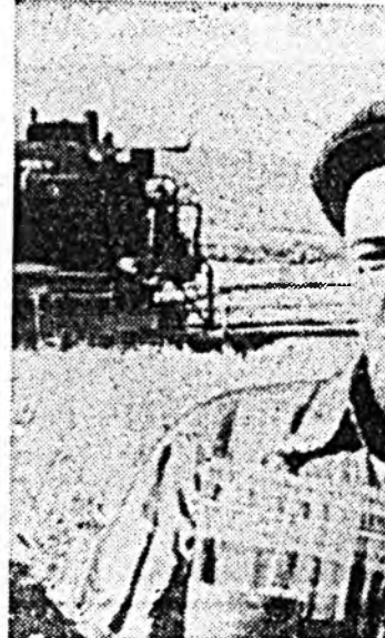
Хуряалгын үдэ эмхидгэдэ социалист мурысөөнэй гүрмн эртүүр зохиогдонхой, баталагданхай, механизатор бо-

руулажа байшадтай тоодо «Одон» совхоз оролоно. Эндэхид арай гэжэ хоёр мянгад гектар гэжэ гү, али тарилгынаа талман хахад хууно унагаагаад, 500 гектарынаа баал сохобд байна. Энэ юун дээрнэ боллоо гэхэдэ эмхидхэлэй хүдэлмэри һула, олонхи комбайнерууд хүдэлмэридөө орой гарана, тэндэнэ эртэ эрэнэ. Аргы угаада, аналда гаргахые ушарнууд үзэгдэнэ.