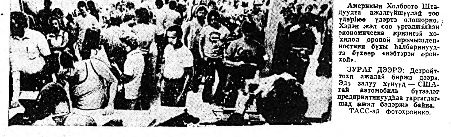
Америка Холбоото Штадуудта ажалгүйшүүлэй тоо үдэрхон үдэртэ олошорно. Хэлэн жэл сое үргэлжэн экономика кризисэй хойшлодо оройн промышленностин бүхэ халбарнуудта бүхэр энэбэрэн оройноу.

ЛИВАНДАХИ БАЙДАЛ ТУХАЙ Израилин политика расмэйн үндэстэй һуури дээр бэлүүлэгдэнэ, хашалта харшалагдаа, хүсэ хэрэгшлэгдэ үндэстэй гэжэ Ливанай политическэ элитэ мэдэжэ ажал абуулагша, республикэин урдын президент С. Франжье мэдүүлэ.