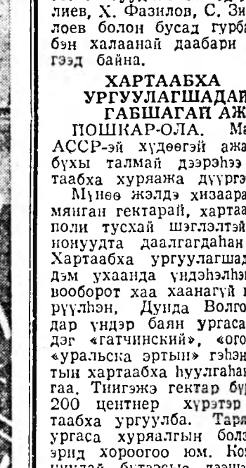
МАЛ АЖАЛАН КОМПЛЕКС