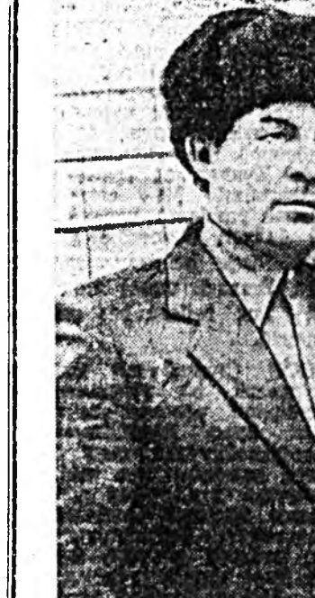
Городонгоо койршоо хүсэд хүрээдэй...