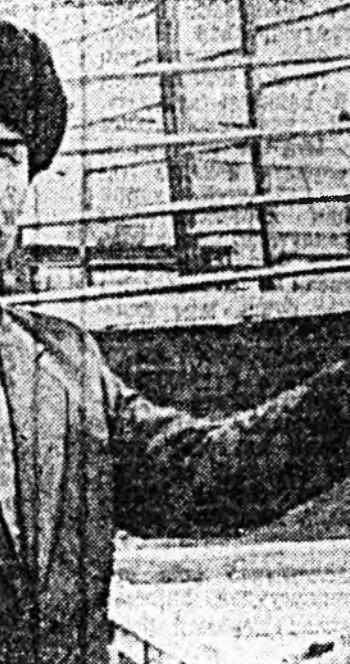
Байгша оной 3-дахн квартал...