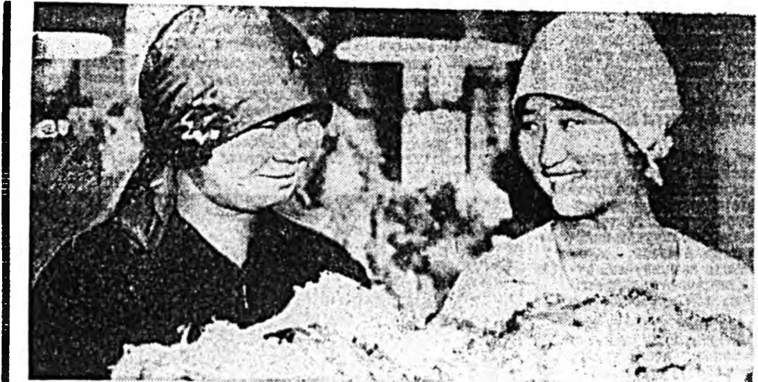
Улаан-Удьян ширин сэмбл комбинатад үнөөч нийгэмд хөдөлмөрийн үнэ...