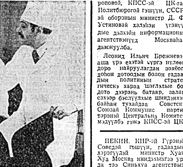
ПЕКНИН КИР-эй Гүрнэй Советэй гүшүүн...