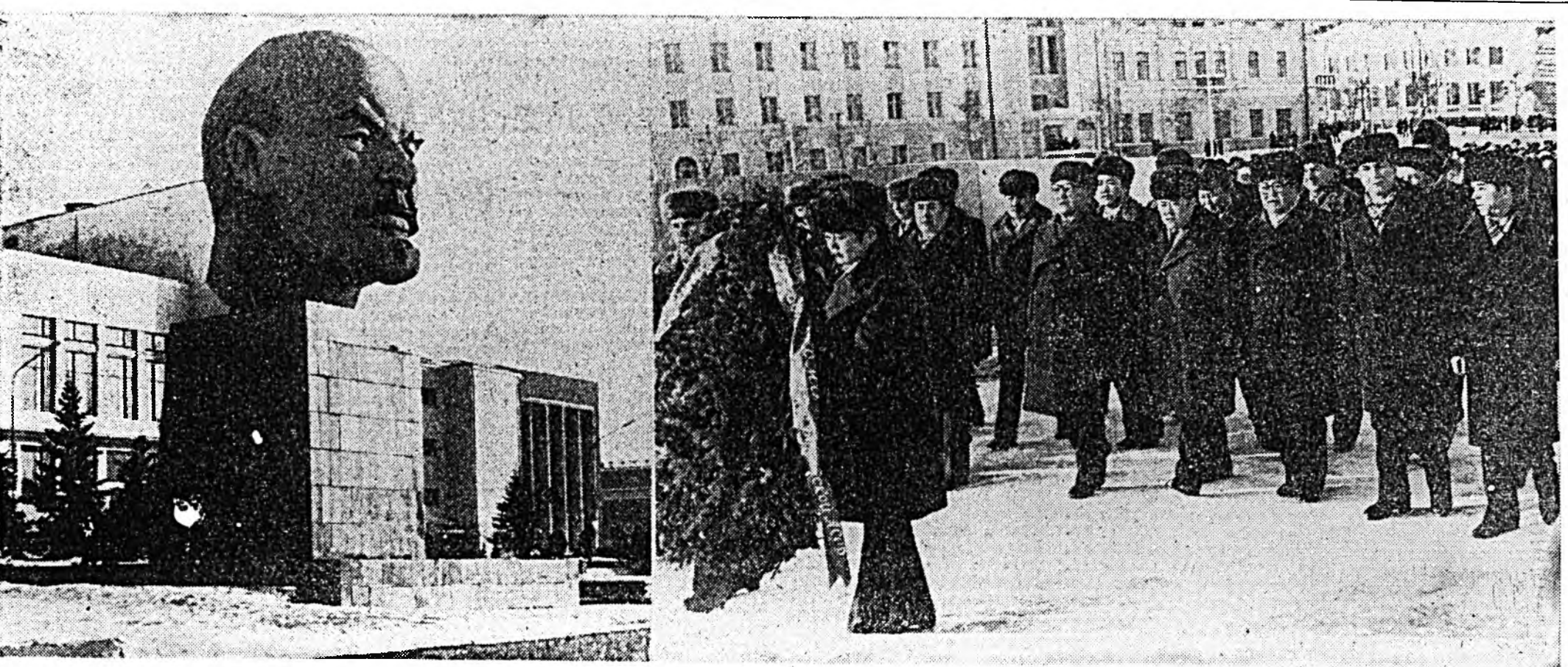
ОЙН БАЯРАЙ СУГЛААНДА ХАБААДАГШАД В. И. ЛЕНИНЭЙ ХҮШӨӨДЭ ВЕНОГУУДЫЕ ТАБИНА.

Мүнөө жэл хоёрдохёо боложо байгаа «Улаан суббото» мүн гээ олон зоний хабаадалгатайгаар ажалдай болон политическэ угаа ехэ дэбжэлтын орлон байдалда үнэгэрхэ лабтай. Энээнине манай редакцида үдэр бүр орожо байһан мэдээсэлүүд гэршэлэн харуулна. Ажална коллектив бүхэн субботнигтой үдэр хэхэ, бүтээхэ хүдэлмэреэ үннэй тодорхойлоһон, хүн зон хубаарилан табигдана гэгшэ. Тинхэлэ, олон тоото коллективүүд субботнигтой тоосоогоор хүдэлжэ эхилээр үннэй Илагшаа барилгад болон транспортын хүдэлмэрилгэгшэд Байгал-Амарай түмэр замшад ба Гусиноозерскын ГРЭС-эй энергетинүүд янала ехэ ажал хүдэлмэри хээд байна. Мүн түдөө нотагуудай хэдэн зуугаад механизаториунуд болон машад табан жэлэй жасада өөһэднөө торгой хубилла орууланхай.